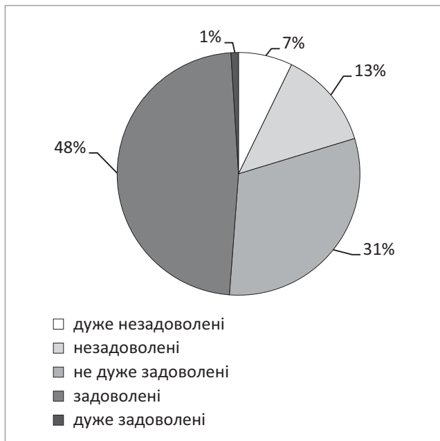
Рис. 3. Ставлення домогосподарств (частка, %) з трьома і більше дітьми до власних житлових умов (168,2 тис. домогосподарств, 2016 р.)