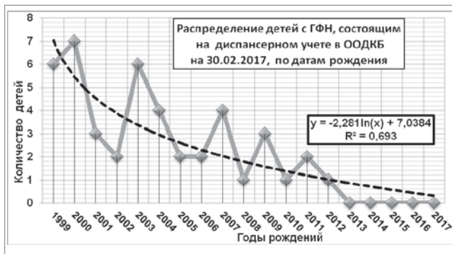
Рис. 1. Возрастной состав детей с дефицитом гормона роста, состоящих на учете в Одесской областной детской клинической больнице