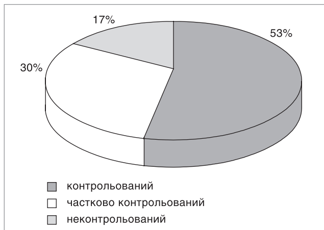
Рис. 2. Структура бронхіальної астми в дітей з контролю хвороби

виснажується порівняно з дітьми без бронхолегеневої патології, що свідчить про неекономічну роботу серця при БА [12].