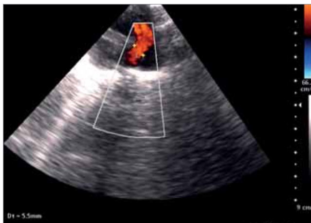
Рис. 1. Широке овальне вікно з вторинним дефектом міжпередсердної перетинки, дилатація правих відділів серця